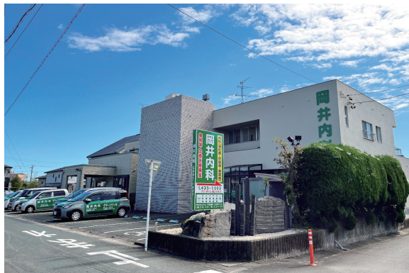
介護支援・デイサービス グリーンサンガ併設